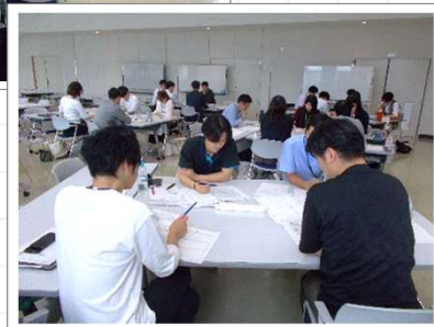
▲ 昨年度のセミナー実施のようす